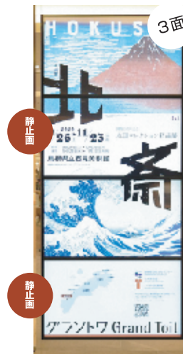
グラントワ「北斎展」