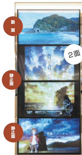
出雲市「神在月のこども」