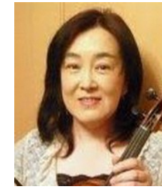
安倍由美子 ヴァイオリン