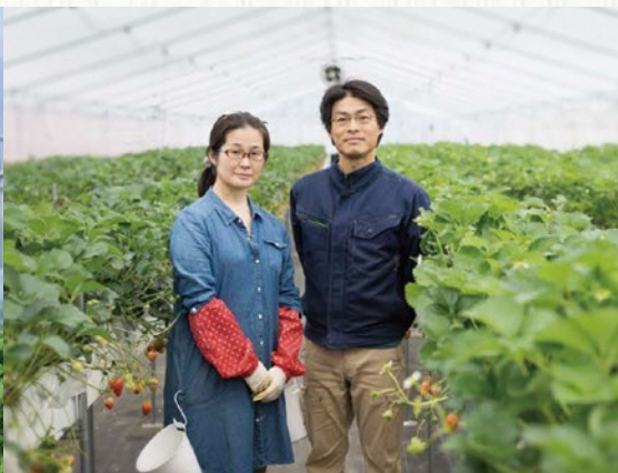
生産者：大森ファームさん